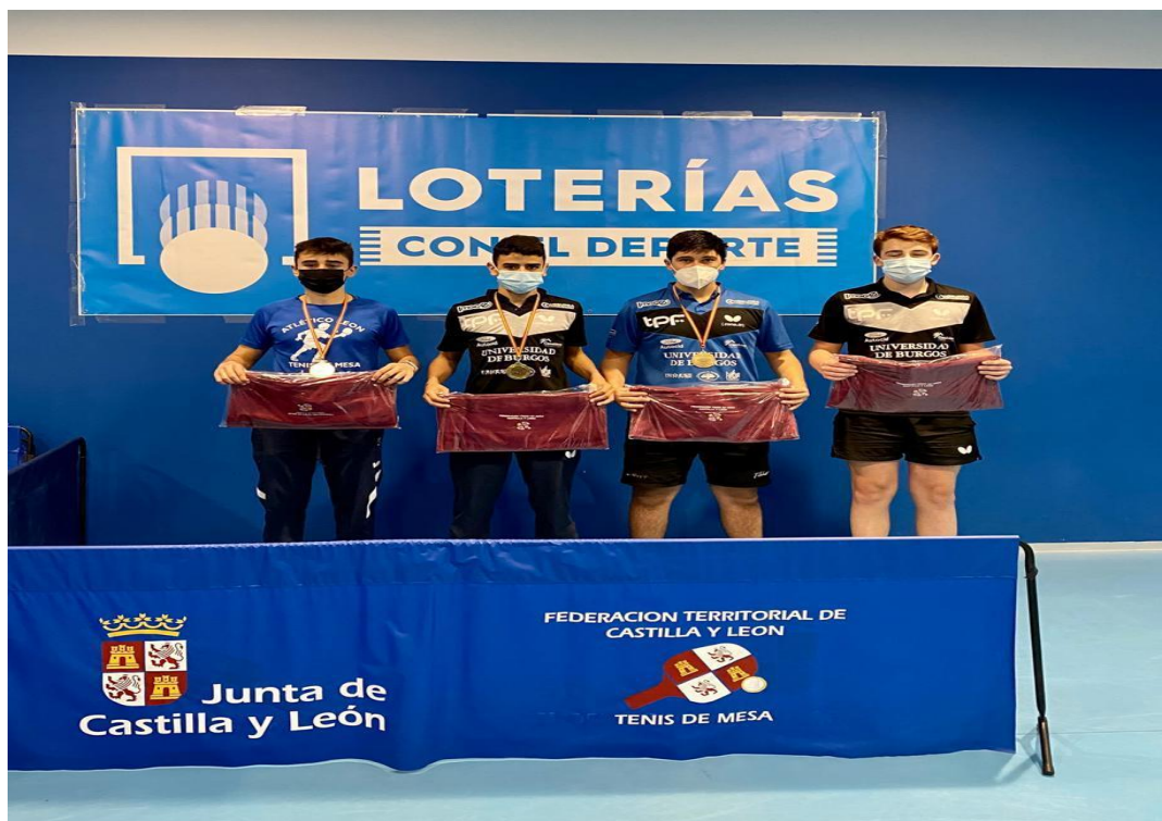
CUADRO HONOR JUVENIL