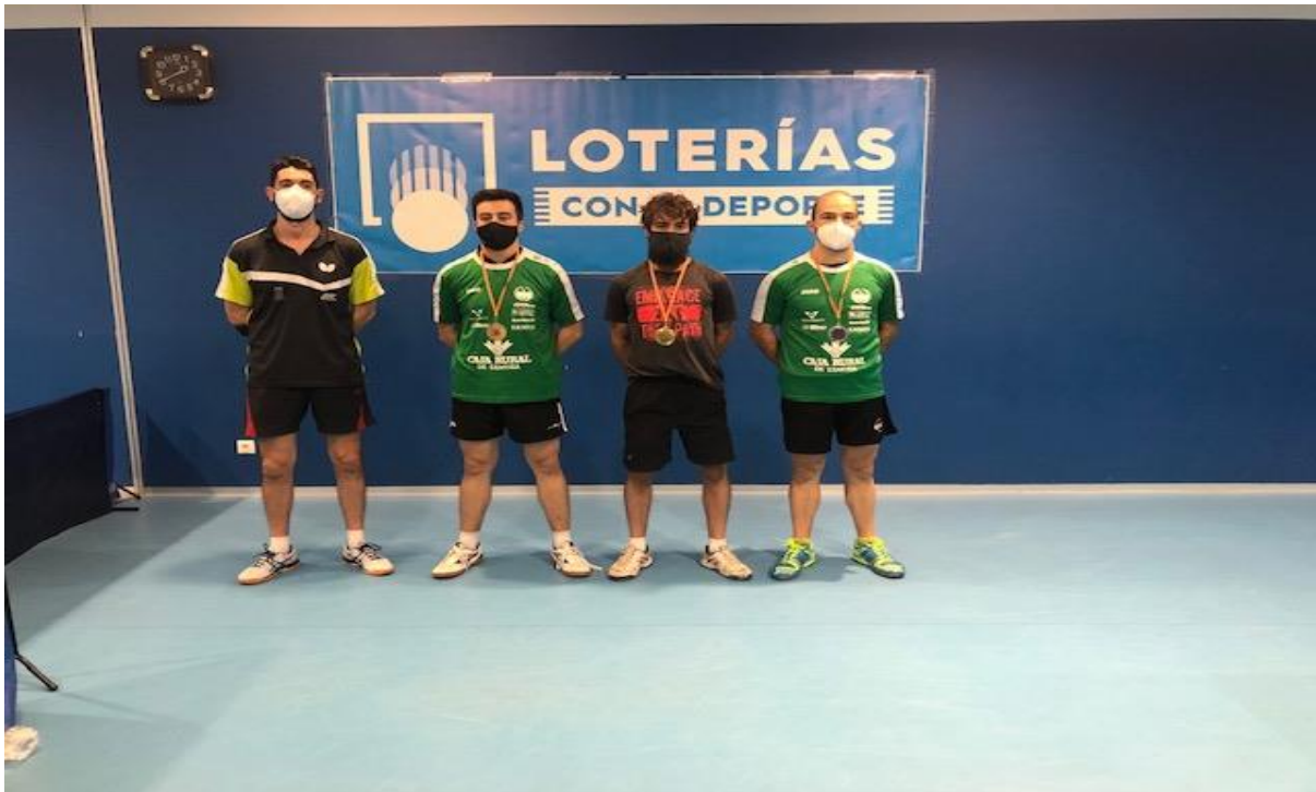
CUADRO DE SENIOR